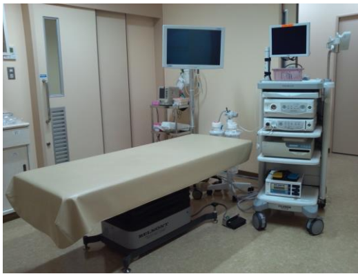
胃カメラ・大腸カメラ

尾道市の特定健診も行っております。この機会にぜひ、ご自身の健康チェックをされてはいかがでしょうか。