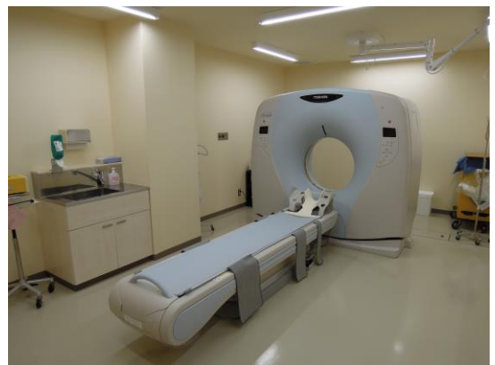
CT コンピュータ断層撮影