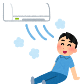
冷房をつけましょう