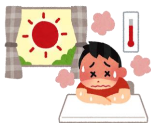
室内でも熱中症は起こります