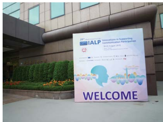
エバーグリーンインターナショナル コンベンションセンター

普段経験することができない、貴重な体験をすることができたと思います。この経験を活かして日常のリハビリテーション業務に励みます。