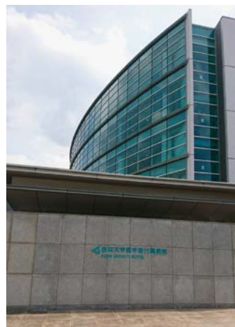
杏林大学医学部付属病院

この7か月で得られた学びや経験を生かし、今後檀上集中ケア認定看護師と共に、重篤な患者さんやその家族の方に寄り添うケアを実践し、より安楽に安心して入院生活を送ることができる看護を提供していきたいと思います。また、できる限り早期に入院前と同様な生活を送ることができるように、多職種と連携し人工呼吸器関連の合併症予防ケアやリハビリテーションなどの早期回復へのケアに取り組むとともに、一般病棟においても異常の早期発見や予防的な看護介入を行えるように取り組んでいきたいと思っています。